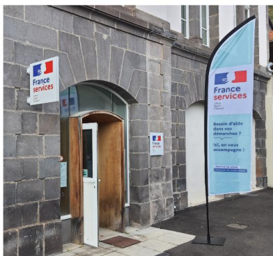
Entrée principale côté Médiathèque